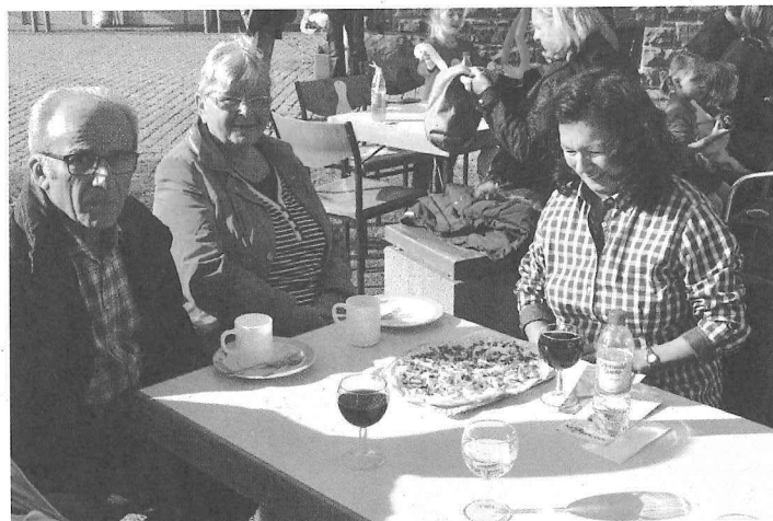
Sonnenschein, nette Gesprächspartner, frisch gebackener Flammkuchen und ein gutes Glas Wein... was will man mehr!